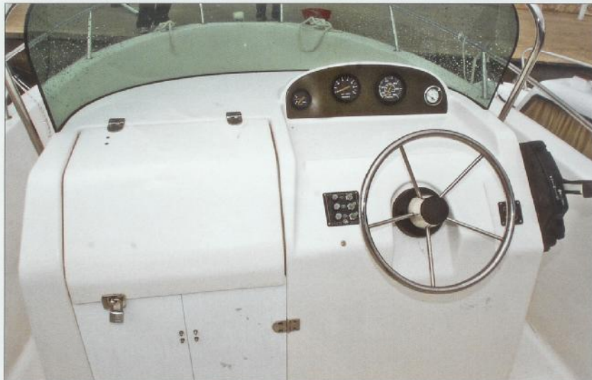
Centralna konzola s velikim spremištem

Testovi brodova se dogovaraju i po nekoliko mjeseci unaprijed, no faktor vremena nitko ne računa pa nismo ni mi. Pokazalo se to kao greška jer je za taj dan Posejdon odlučio malo uzburkati more. Poslao je veliko jugo, no ploviti se mora, kaže stara poslovica. Kod grubog mora problem je u tome što skupa foto-oprema ne voli vodu, a kamo li more. No, nije samo foto-oprema problem! Problem je bio što smo morali testirati otvoreni fisherman dugačak per i pol metara pa se trebalo i dobro namočiti, znala je cijela ekipa. Inače je u stvarnosti to tako, no Atlantic 555 nas je ugodno razveselio. Naime, kako smo testirali i njegovog većeg «brata» Atlantic Pilot House 560 o kojem smo pisali u broju 12 2007. godine, najprije je poslužio kao platforma za foto-aparat. Moramo odmah reći da smo ostali suhi jer Atlantic 555 sjajno prolazi kroz val, makar se radi o potpuno otvorenom