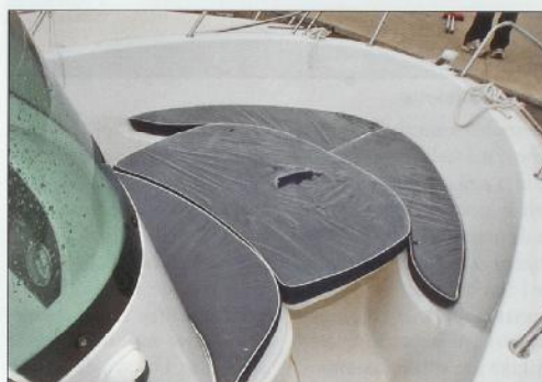
Složeno ležište na pramcu

Honda BNF 90 OHC 90 KS maksimalna snaga motora 120 KS