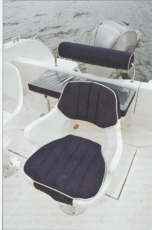
Stolac, klupa i zatvorene platforme

laze se dva sjedala za skipera i putnika. Iako je ovo u obitelj- skoj verziji i te kako prihvatlji- vo, kod ribolova dobro bi bilo maknuti jedan stolac, pogoto- vo kod panule jer zauzima pre- više mjesta. Ovo dakako nije kritika, nego više savjet kada se krene u ribolov. Na razmi je sa svake strane daska od plemenitog drveta, a što se tiče ribolova trebalo bi u njoj napraviti još jednu rupu i u nju staviti dodatne nosače štapova.