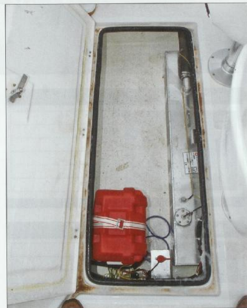
Spremište u podu palube

ra i treba mu kratko vrijeme da postigne zavidnu brzinu. Kao što smo rekli, ni jako jugo nije nikakva prepreka za Atlantic 555, no tada ipak morate biti spremni za određenu količinu mora koje prska usprkos velikom vjetrobranu, ali ne vjerujemo da će se netko uputiti u veliko more, osim kada je zaista potrebno. No ako vas