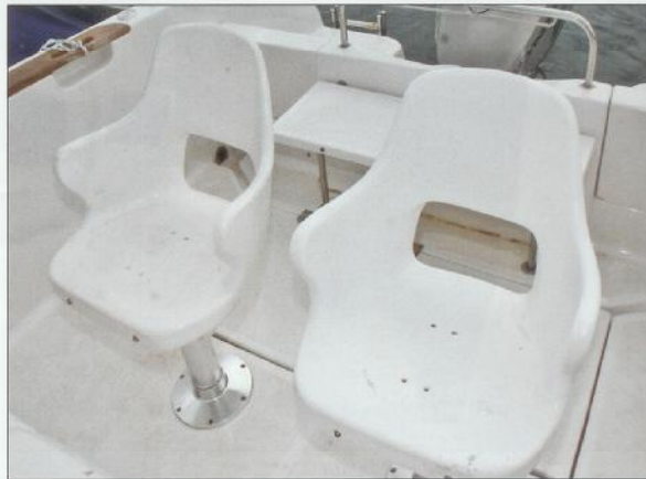
Sjedala za skipere i putnika

Osnovna oprema Atlantic 555 je u odnosu na druge fishermane slabija, no to nam se i dopalo jer nema bespotrebnih «revolucionarnih» dijelova opreme koje više smetaju nego koriste. Tako u osnovnu opremu ubrajamo tapeciranu klupu za skipera i putnika, pregibni naslon klupe skipera i putnika, jastuke na pramčanom dijelu