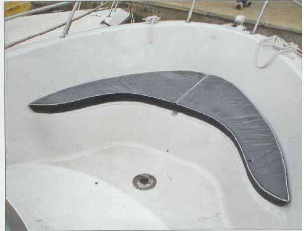
Klupa na pramcu

Oplakanim dijelom trupa Atlantic je čisti gliser s dubokim V dijelom koji je zaslužan za dobro držanje mora u brzom krivudanju. Ovaj fisherman brzo «izlazi» iz mo-