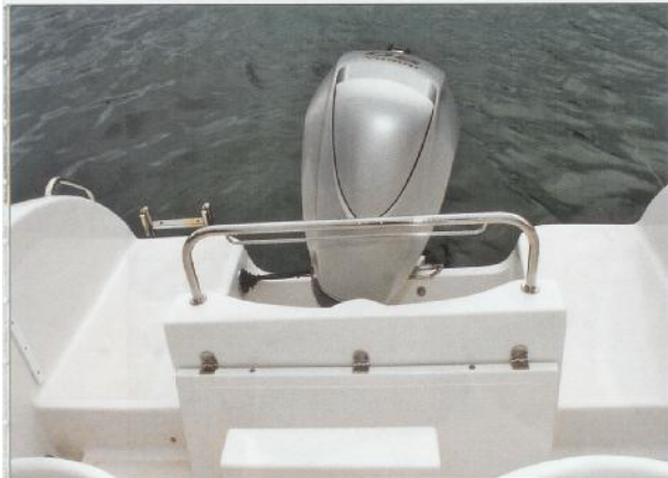
Platforme bez vrata

ko od obale, što smo dokazali plovidbom po zaista jakom jugu, a da pri tome nismo ni jednom bili u problemima, dapače, jurcali smo po jakom jugu iz čistog zadovoljstva i tjeerali Atlantic maksimalnom brzinom što ne preporučamo onima manje vičnim moru. Sve je to bila «dječja igra» za Atlantic 555 pa ga svrstavamo