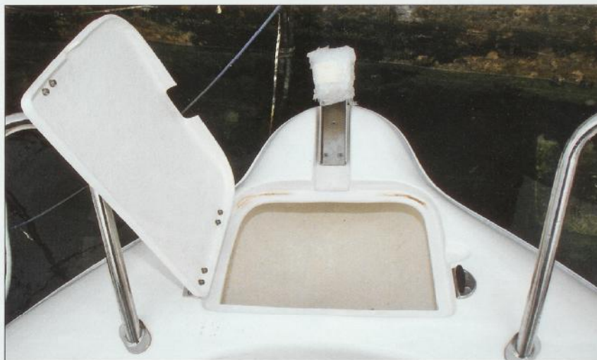
Sidrena buža na pramcu